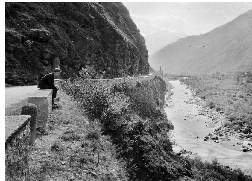
Ferdinando Gianella, Strada del Satro, 1900 circa. (Archivio di Stato del Cantone Ticino, Fondo Famiglia Gianella)

La produzione fotografica di Ferdinando Gianella, analogamente ai documenti fotografici di altri autori conservati nell'archivio di famiglia, va in buona parte ricondotta alla sua professione, con molte immagini relative a strade, ponti e linee ferroviarie tra la fine dell'Ottocento e l'inizio del Novecento. Da questi scatti si intuisce come Gianella attribuisse alla fotografia non soltanto un valore documentale o celebrativo bensì anche una valenza tecnica, considerandola uno strumento suscettibile di agevolare il mestiere dell'ingegnere. D'altra parte, in molte lastre di carattere privato, F. Gianella denota una certa originalità fotografica, non disdegnando la sperimentazione (come si desume dalle sue agende) o l'ironia, lasciando a tratti intravedere uno sguardo molto moderno (si veda per esempio la fotografia «Albero strano» a Comprovasco). Infine, rileviamo come nell'archivio della famiglia Gianella siano presenti anche immagini riconducibili a Riccardo Gianella, figlio di Ferdinando, che dal padre ereditò, oltre alla professione, anche l'interesse per la fotografia (si vedano le immagini della